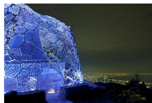
自然体感展望台 六甲枝垂れ

・自然体感展望台 六甲枝垂れ しだ 大人 250円(通常 300円) 小人 150円(通常 200円)