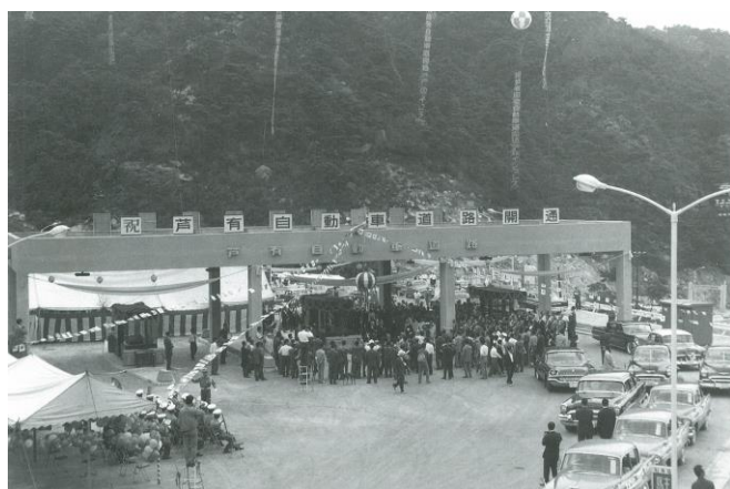
開通式当時(昭和36年)

芦有ドライブウェイの途中にある東六甲展望台からの景色は絶景です。特に夜景は大阪平野を一望でき、一見の価値があります。この機に六甲山上からの神戸の夜景と合わせて楽しんでください。