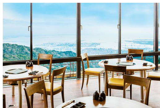
ジンギスカンテラス