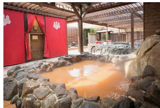
有馬温泉 太閤の湯 金泉源泉かけ流し「太閤の岩風呂」

※当日の芦有ドライブウェイレシート1枚につき6名様まで (他の割引・特典との併用不可、別途入湯税75円要)